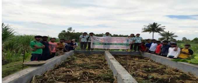
Different composting techniques demonstration