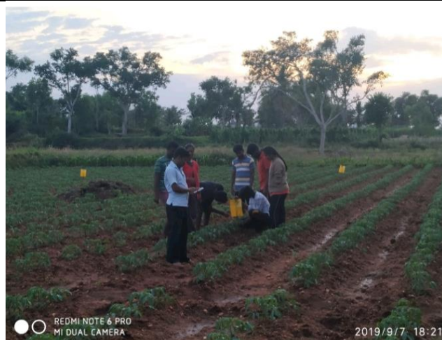
Farm and home visit by students