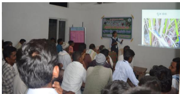
Integrated pest management in agricultural and horticultural crops