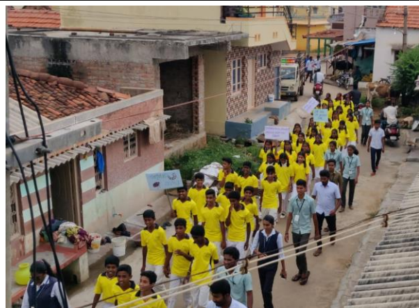
Campaign on Root grub management