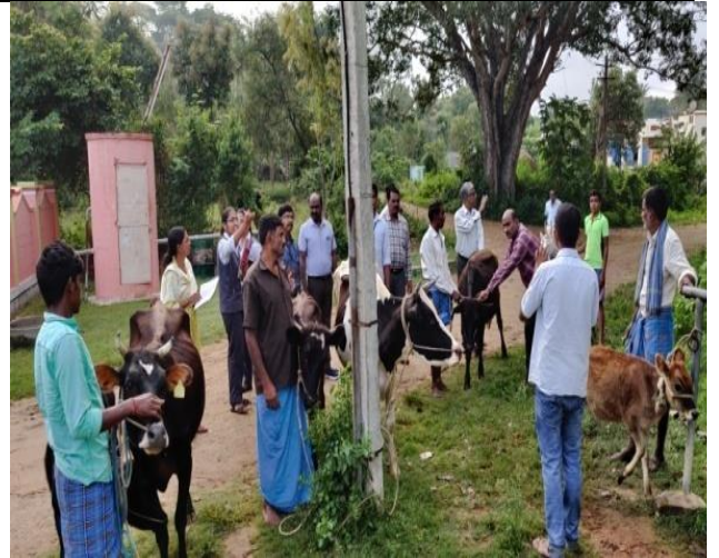
Animal Health Campaign