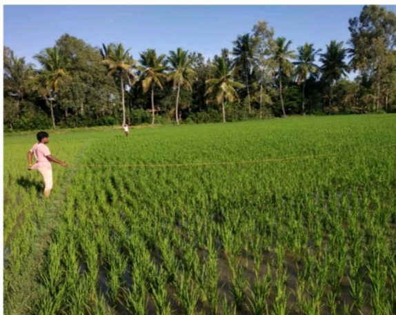
Case worm management in paddy using rope pulling technique