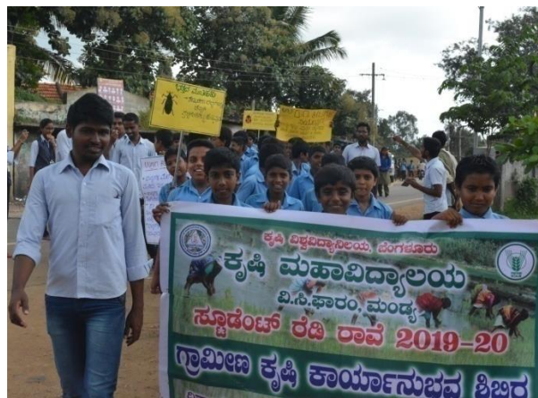
Campaign on storage pests management