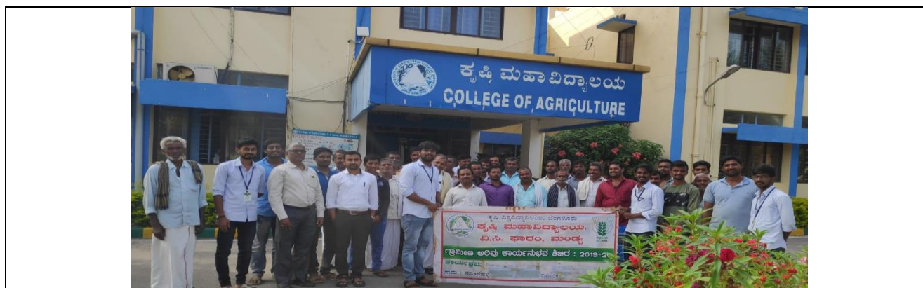
Farmers visit to College of Agriculture, VC Farm, Mandya as educational tour