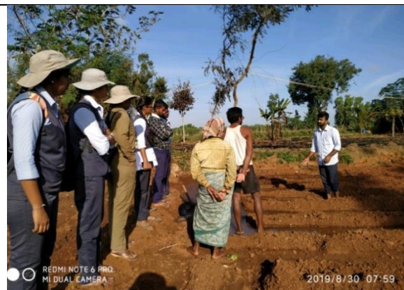
Information collection from farmers by RAWE students