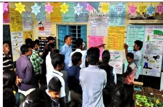
Farmers visit to Information Centre