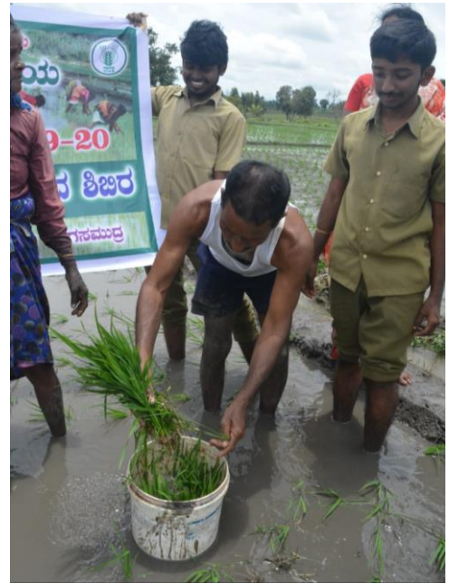
Paddy seedling root dip in bio-pesticide