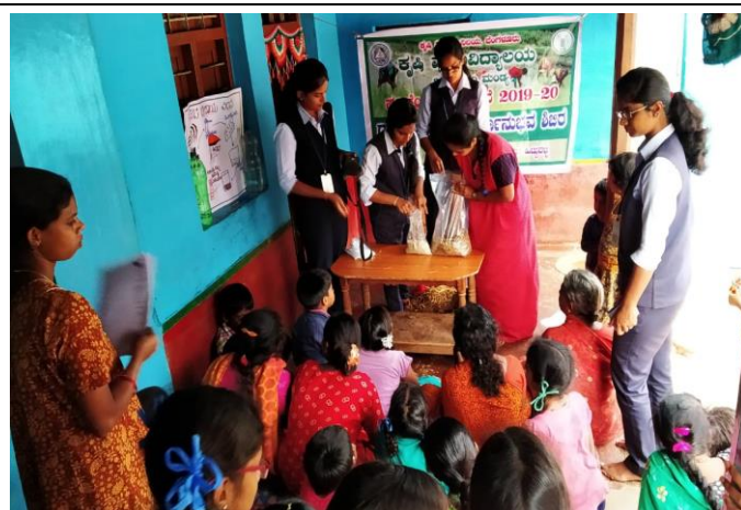
Mushroom cultivation demonstration