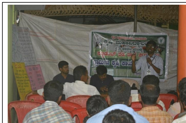
Agroforestry and crop insurance