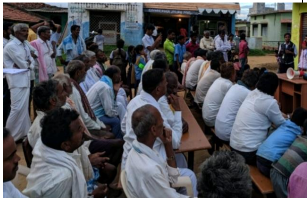
Problematic soil management