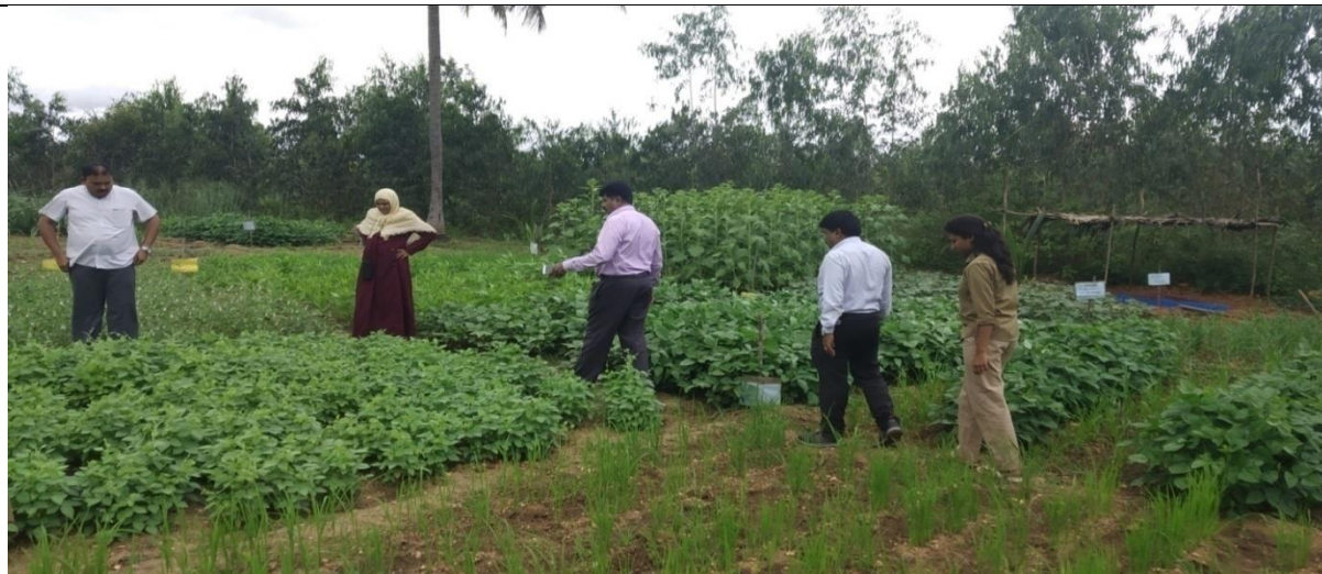
Visit to Nutritional garden by experts of College