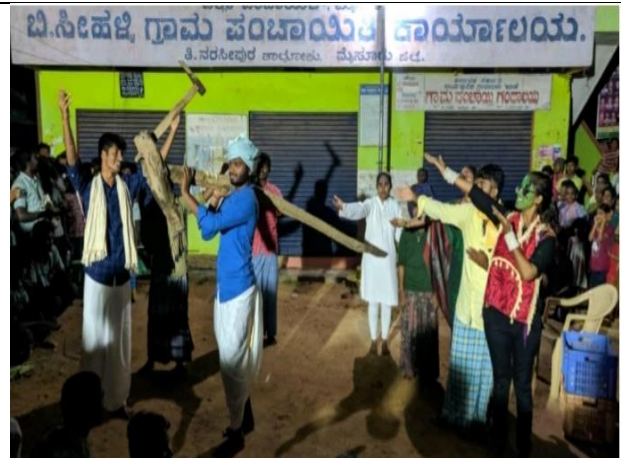
Street play on importance of scientific agriculture