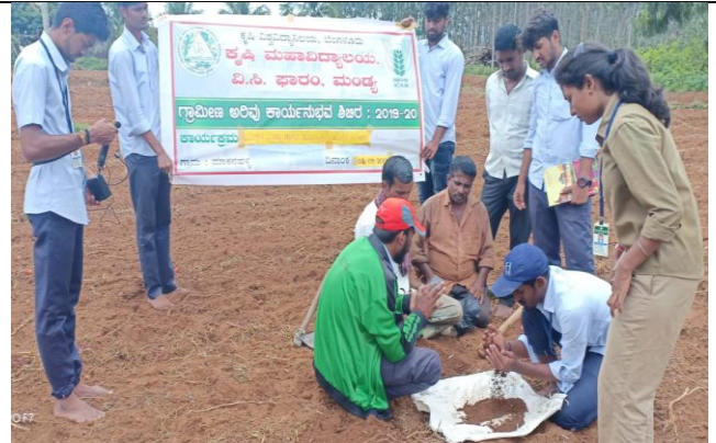
Soil sampling demonstration