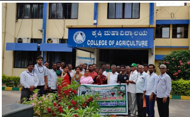
Farmers visit to College of Agriculture, VC Farm, Mandya as educational tour