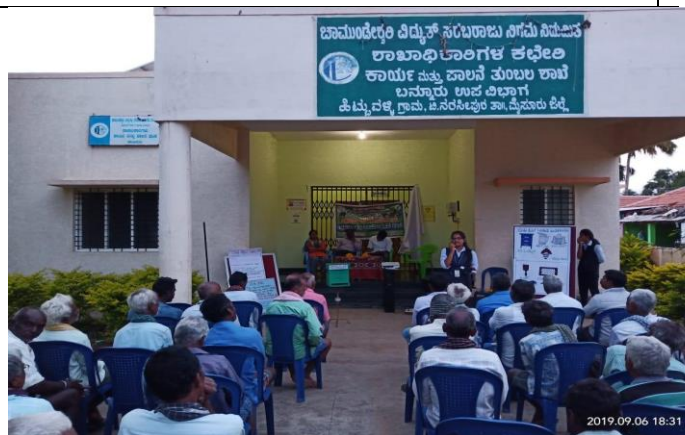
Integrated Nutrient Management in coconut