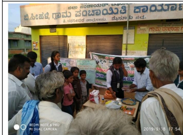
Seed treatment demonstration