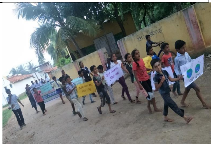
Campaign on plastic and parthenium eradication