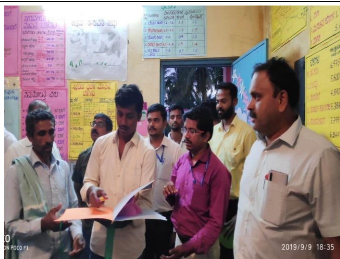
Agricultural Information Centre