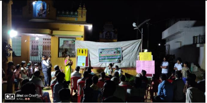
Apiculture and sericulture importance