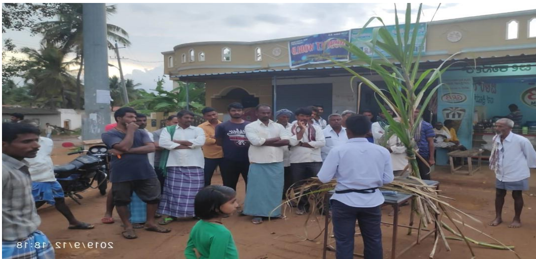
Treatment of sugarcane sett with bio-pesticides