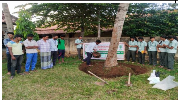
ICM in horticultural crops