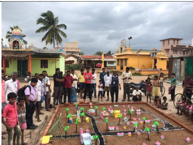
Participatory Rural Appraisal