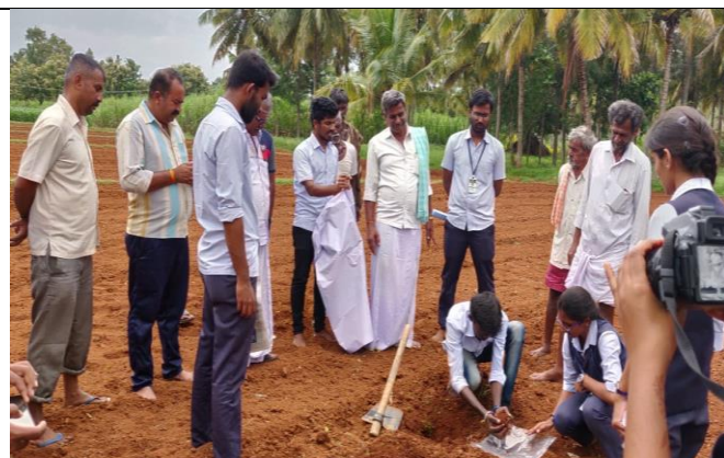
Demonstration on soil sampling