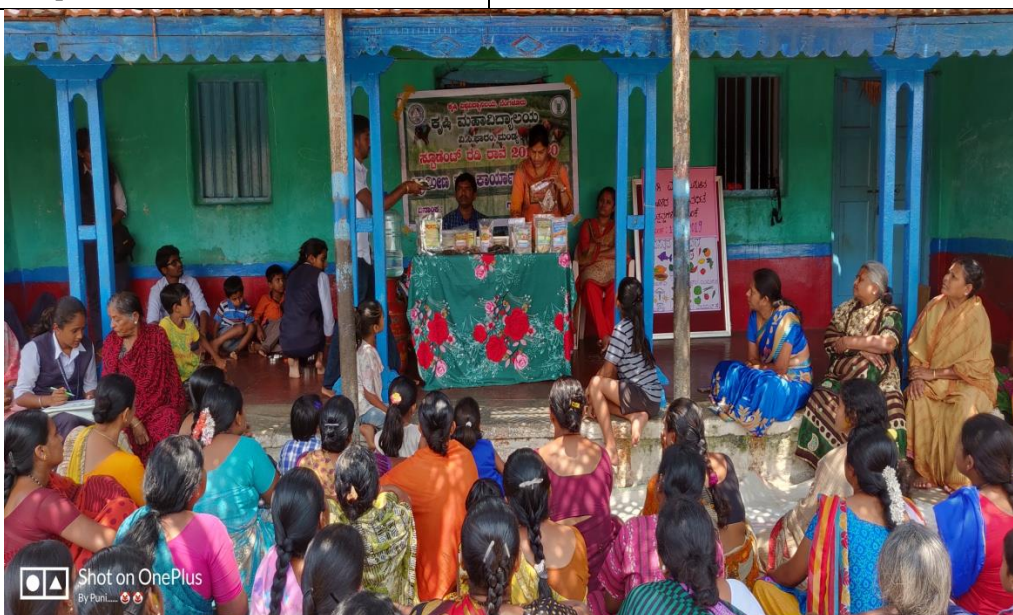
Demonstration on preparation of value added products from cereals and pulses