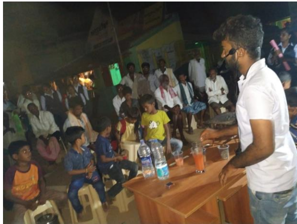
Identification of adulteration in chemical fertilizers