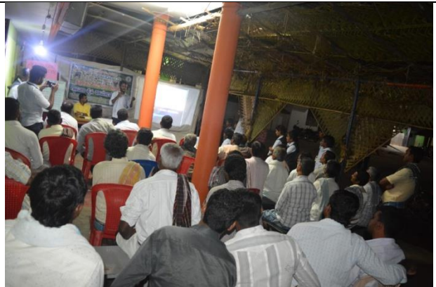
Use improve farm machinaries in agriculture