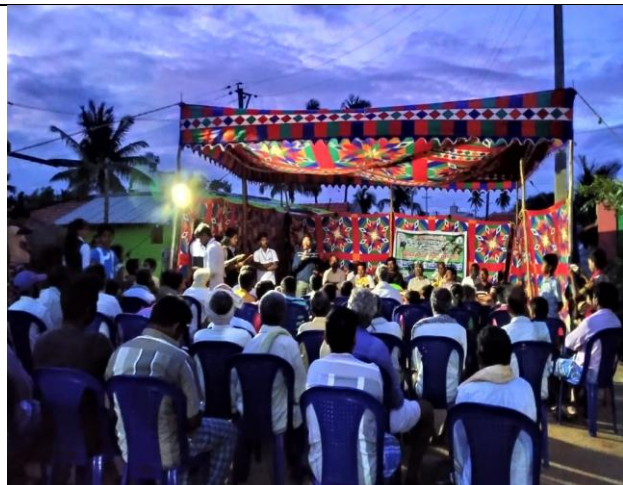
General Body Meeting