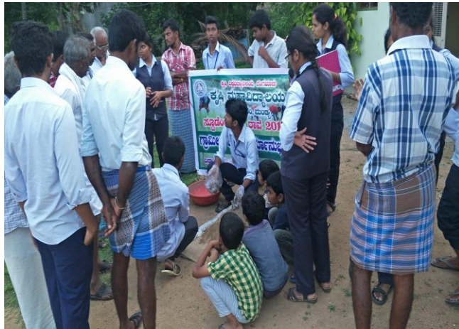
Use of trichoderma in compost enrichment