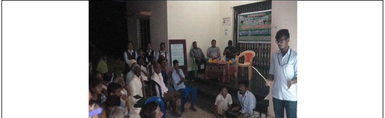
Integrated Crop Management in Paddy