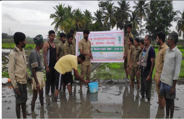
Paddy seedling treatment and row planting demonstration