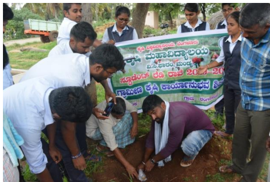
Root feeding demonstration in coconut