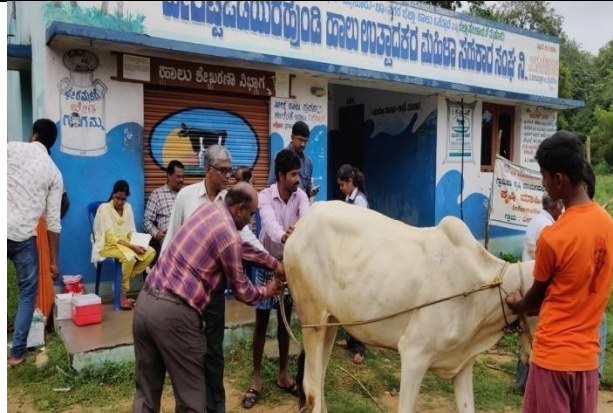
Animal Health Campaign