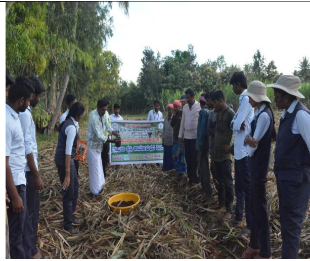
Trash management in sugarcane